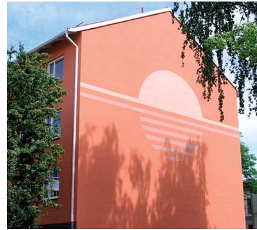
Brunnskatan, Nyköping, Sverige