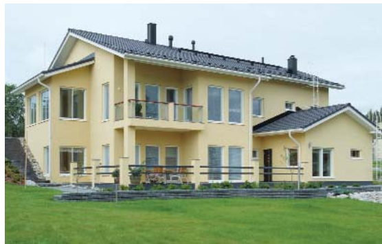
Messukatu, Laukaa, Finland