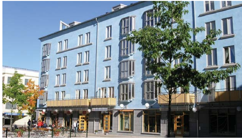
Magasinstorget, Linköping, Sverige