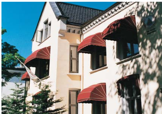
Wergelandsveien, Oslo, Norge