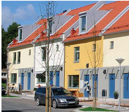
Tinnerbäcksgård, Linköping, Sverige