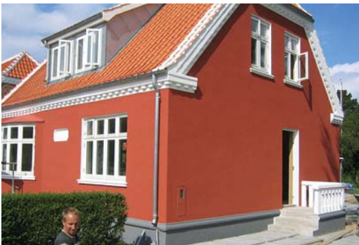
Museumstien, Skagen, Danmark

När en vägg ska putsas skall normalt förvattnings av väggen utföras, så att underlagets sugförmåga reduceras. För att slippa detta moment kan istället något av Stos effektiva grundningsmedel användas. Stos vattenavvisande ytputs eller fasadfärg förhindrar effektivt att väggen blir våt, vilket gör att det beräknade isolervärdet behålls. Torra väggar är varma väggar. Önskas ett mineraliskt system, rekommenderas Stos silikatputs eller silikatfärg som ytbehandling.