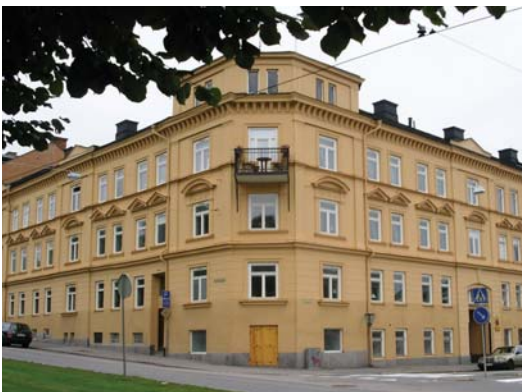
Åbygatan, Norrköping, Sverige