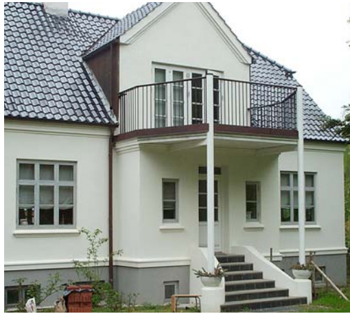
Hørhavevej, Århus, Danmark